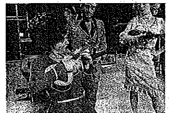
Teergevoelig bonsai-wereldje.

Zo minimalistisch de replieken, zo ritmisch precies de dialogen waarin ze passen. Reijs en Van Vliet, plus hun drie muzikanten met rode kaboutermuts, balanceren met sprekend gemak tussen uptempo